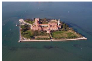
San Lazzaro degli Armeni

Prima colazione in albergo. Visita delle isole di San Servolo e San Lazzaro degli Armeni.