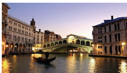
Venezia, il Canal Grande e il ponte di Rialto