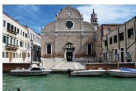
Chiesa dei Carmini

Prima colazione in albergo. La giornata sarà dedicata alla Scuola di San Giorgio agli Schiavoni, alla chiesa di San Sebastiano, alla chiesa di San Nicolò dei Mendicoli, alla chiesa dei Carmini e alla Scuola dei Carmini. Pranzo libero a Venezia. Alla sera, rientro in albergo. Cena al ristorante.