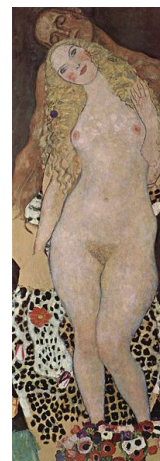
Adamo ed Eva

Data delle visite: - Mercoledì 28 Maggio 2014 alle ore 15.15 e - Venerdì 30 Maggio 2014 alle ore 15.15